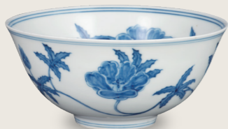
青花 蜀葵紋 碗 (「大明成化年製」銘) 明時代 成化 (1465-1487) 景德鎮窯 住友集團捐贈/安宅收藏