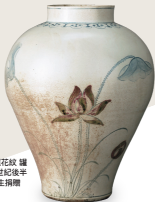
青花銅紅彩 蓮花紋 罐 朝鮮時代 18世紀後半 安宅英一先生捐贈