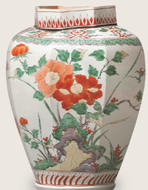
五彩 牡丹椿紋 八角罐 江戸時代 1680-1710年代 肥前 有田窯