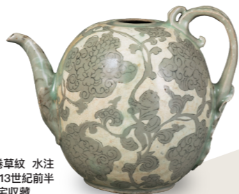
重要文化財 青瓷象嵌 童子實相花卷草紋 水注 高麗時代 12世紀後半-13世紀前半 住友集團捐贈/安宅收藏