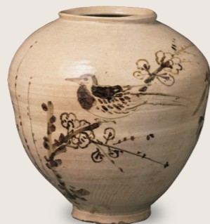
鐵砂 (鐵繪) 梅鳥紋 罐 朝鮮時代 17世紀後半 李秉昌博士捐贈