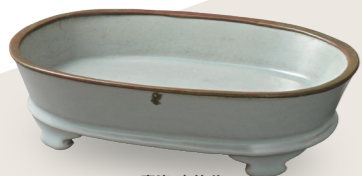
青瓷 水仙盆 北宋時代 11世紀末-12世紀初 汝窯 住友集團捐贈/安宅收藏