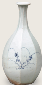
青花 草花紋 八稜瓶 朝鮮時代 18世紀前半 住友集團捐贈/安宅收藏