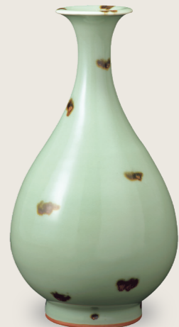
國寶 青瓷褐斑 玉壺春瓶 元時代 14世紀 龍泉窯 住友集團捐贈/安宅收藏