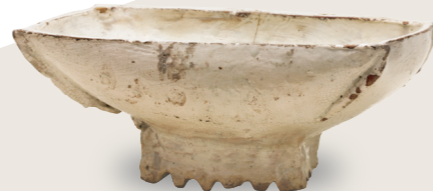
분청담병 보 조선시대, 15세기 스미토모그룹 기증/ 아타카 컬렉션