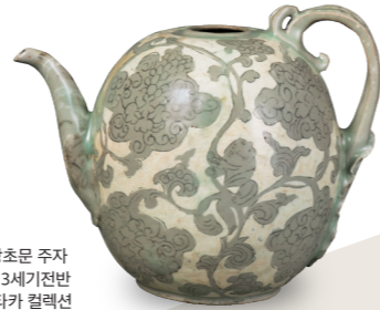
중요문화재 청자상감 동자보상화당초문 주자 고려시대, 12세기후반-13세기전반 스미토모그룹 기증/ 아타카 컬렉션