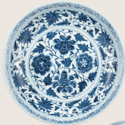
중요문화재 청화 모란당초문 반 원시대, 14세기 경덕진요 토타타 켈조 씨 기증