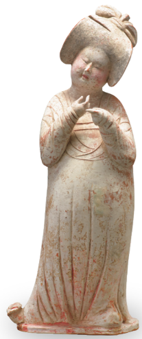
가채 부녀용 당시대, 8세기 스미토모그룹 기증/ 아타카 컬렉션