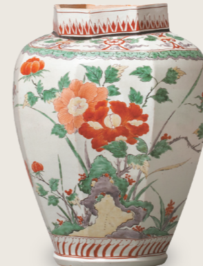
색회 모란동백무늬 팔각호 에도시대, 1680-1710년대 히젠/아리타요