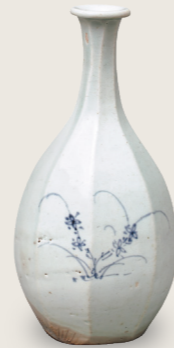
청화 초화문 각병 조선시대, 18세기 전반 스미토모그룹 기증/ 아타카 컬렉션