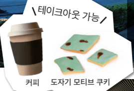
커피 도자기 모티브 쿠키