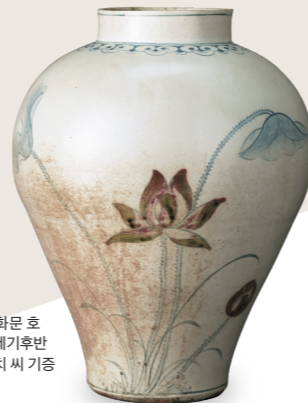
청화동화 연화문 호 조선시대, 18세기후반 아타카 에이이치 씨 기증