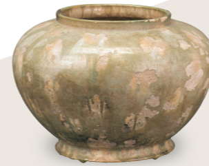
중요문화재 삼채 호 나라시대, 8세기 스미토모그룹 기증/ 아타카[安宅] 컬렉션