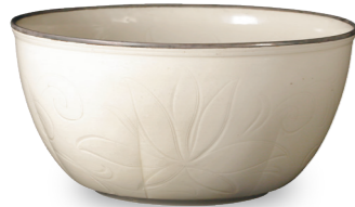
중요문화재 백자각화 연화문 세 북송시대, 11-12세기 정요 스미토모그룹 기증/ 아타카 컬렉션