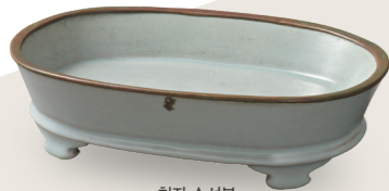
청자 수선분 북송시대, 11세기말-12세기초 여요 스미토모그룹 기증/ 아타카 컬렉션