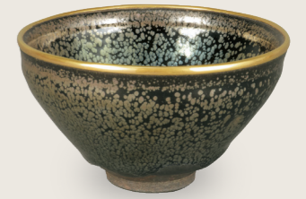
국보 유적천목 다완 남송시대, 12-13세기 건요 스미토모그룹 기증/ 아타카 컬렉션