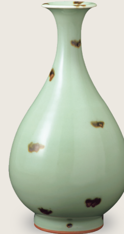
국보 청자 철반문 꽃병 원시대, 14세기 용천요 스미토모그룹 기증/ 아타카 컬렉션