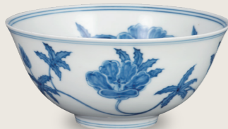
청화 황촉문 안 ( ㄹ 대명성화년제, 명) 명시대, 성화 (1465-1487) 경덕진요 스미토모그룹 기증/ 아타카 컬렉션